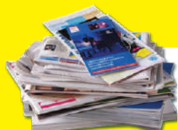
Tous les papiers