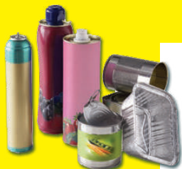
Emballages métalliques (boîtes de conserves, canettes...)