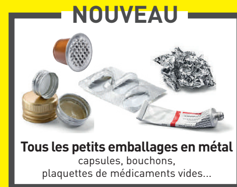
Tous les petits emballages en métal capsules, bouchons, plaquettes de médicaments vides...