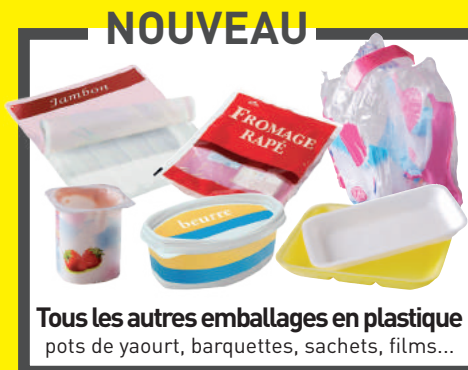
Tous les autres emballages en plastique pots de yaourt, barquettes, sachets, films...