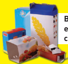
Briques et petits cartons

Les gros cartons doivent être apportés en déchèterie.