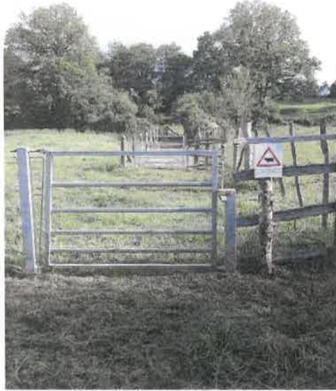
Merci de refermer le portillon ! Fin d'itinéraire et arrivée sur Burgnac.