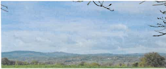
Vue sur les monts des Cars.