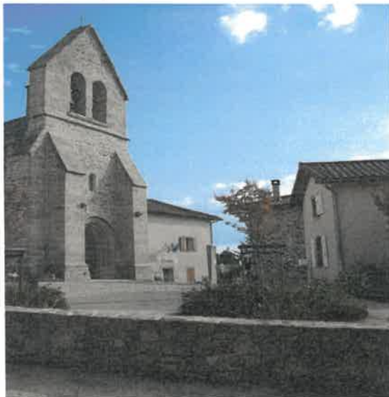
Le bourg de Burgnac, la mairie et l'église